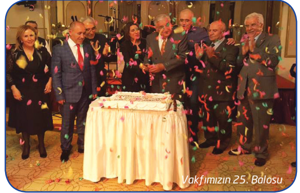
Vakfımızın 25. Balosu

Kısaca, Vakıf Merkezimiz, kısıtlı olanaklara karşın, Niğde'nin ve Niğdelilerin Başkent Ankara'da tüten bir Baba Ocağı niteliğinde olup; hemşehrilerimizin ilgisi devam ettiği sürece bu ve benzeri faaliyetleri devam edecektir.