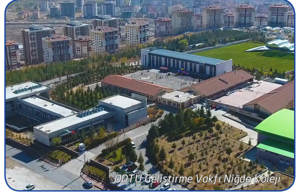
ODTÜ Geliştirme Vakfı Niğde Koleji