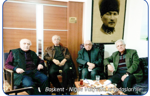
Başkent - Niğde Vakfında, arkadaşları ile