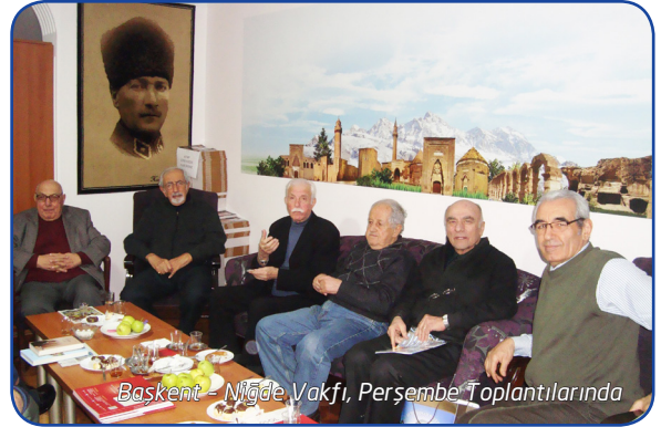
Başkent - Niğde Vakfı, Perşembe Toplantılarında

Eğitim Bursu veya diğer yardımlar bakımından Vakfımızın hep en önemli destekçileri arasında yer almış, bu konuda kendisinden çok çok daha varlıklı pek çok hemşerimizin önüne geçmiştir.