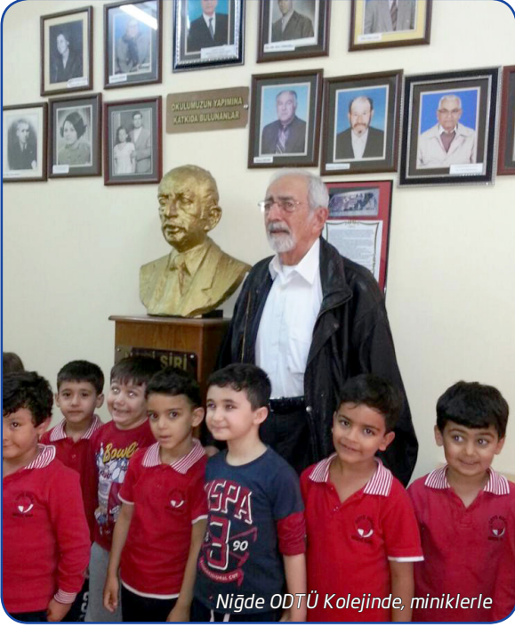
Niğde ODTÜ Kolejinde, miniklerle