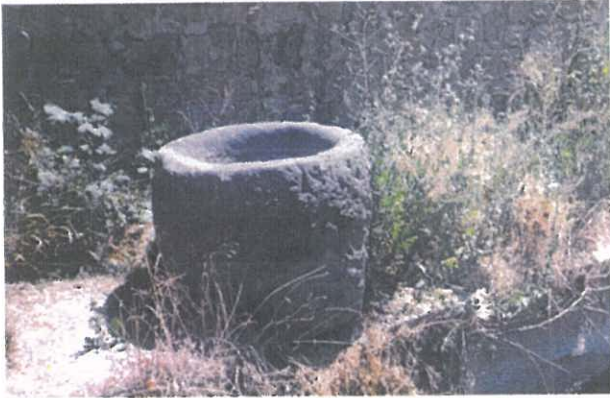
Soku (Taş Dibek)

NOT: Karlı kış gecelerinde, kocaman bakır bir sininin içine öbek öbek dövme çekirdeği çıkarılarak kurutulmuş kayısı ya da şekerpare, ayıklanmış kuru ceviz içi, kuru üzüm ve köfter dilimleri konurdu. Sonra misafirlere ikram edilir, hem de bu çerezler zevkle yenirdi.