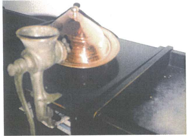
Eski mutfaklarda et çekilen, sucuk, mumbar doldurulan et makineleri.

NOT: Köfter piştikten sonra, kaplara boşaltılırken az miktarda tavada bırakılır. Hane halkı ve komşular toplanıp ayıklanmış taze ceviz atarak kaşıkla dibini sıyırlar. Buna tava yalama denir.