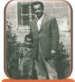
Hazırlayan: H. Naim ŞENOL

B ahar Lodos rüzgarları ile gelir. Hava ısınmaya başlar, fakat kuytu, kuzeye bakan sokaklarda karlar Mayıs ayı sonuna kadar kalır. Bağların görünümü de birden değişir. Parça parça kar yığınları çıplak dağları süsler. Çayırlar, ekinler büyümeye başlar ve ağaçlar açık tatlı bir yeşille yapraklanır. NİĞDE dillere düşecek kadar güzelleşir. Yol kenarlarında bile kırmızı turuncu gelincikler ve papatyalar açar. Bahçelerde ve bağlarda mor sümbül ve deve boynu ile sulak çayırıklarda uzunca sarı su çiçekleri açar. Bu güzellik ve bahar türkülere yazılmış, her yerde hala söylenir. "Yine yeşillendi Niğde bağları"