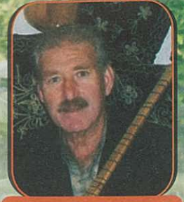
Hazırlayan: Sabri ÖZDAĞ