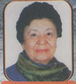
Hazırlayan: Nezahat ÇELİK

Ben bir sokak köpeğiyim Hiçbir hakkım yok Hatta yaşama hakkım bile Siz benden korkarsınız Ben sizden Oysa ben bir şey yapmam size Bir lokma yiyecek için Kapanırım ayaklarınıza Ellerinizi yalarım Bir sahibim olsun isterim Arasına başımı okşayan Yiyecek vermeseniz de olur Sevginiz yeter bana Sizinle konuşamam Konuşabilsem neler anlatırdım Benim de başım ağrır sizler gibi Ben de aşık olurum Tekmelendiğimde, sopa ile dövüldüğümde kahrolurum Ben bir sokak köpeğiyim Hiçbir hakkım yok Beni sevin ne olur Ben sizi seviyorum.