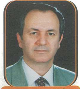
Hazırlayan: Yavuz DEMİRTAŞ

Hemşerilerimizi "Dernek" yerine "Vakfımızda" bir araya getirmemizin en önemli sebebi 12 Eylül Darbesinde kapatılan Niğdeliler Derneğinin yaşadığı zorlukları yaşamamaktı. Bu amaçla vakıf senedine, maceracı grupların bir anda yönetimi ele geçirmelerini engelleyici bazı "kilit maddeler" koyduk.