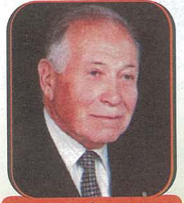
Hazırlayan: A. İhsan BEYHAN