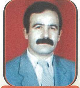
Hazırlayan: Celal KESEK