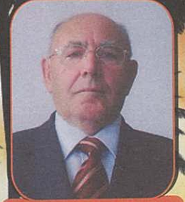
Hazırlayan: Kemal AKMAN