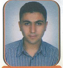
Hazırlayan: Kadir TEKİN Ankara Üniv. Hukuk Fak. 4. Sınıf Öğ.

2000 yılından sonra ilçe yerel yöneticileriyle ve idealist kaymakamlarıyla atılım yapmış, hızla yükselmiştir. 2001 yılında meşhur şelek'in bayırının dinamitlere patlatılarak düşürülmesiyle kışın Niğde'yle