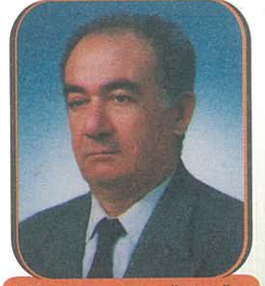
Hazırlayan: Adnan ÖZDOĞAN