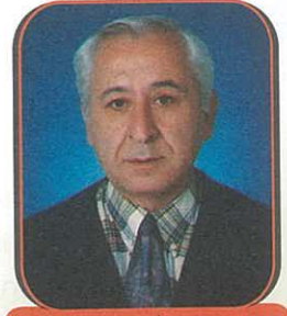
Hazırlayan: Dr. İsmail KILINÇ

Dergimizin 65-66. sayısında belediyenin yeni projeleri ile ilgili de burada birkaç söz söylemek istiyorum. Projeler kent için, kent yaşamı için. Ama bir ayağı eksik gibi görünüyor. O da kültür ya da sanat projelerinin olmaması. Spor etkinlikleri de sadece futbol açısından değerlendirilmemelidir. Su, kent ormanı, toplu konut, otopark gibi projeler önemli. Ama çöp toplama konusunda birkaç sözümüz olacak. Bildiğimiz