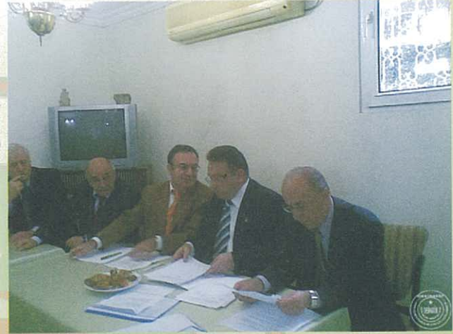
Divan ve yönetim Kadrosu

Genel kurul sonunda yapılan seçimlerde yeni yönetim, denetim ve disiplin kurulu üyeleri aşağıdaki biçimde oluşturuldu.