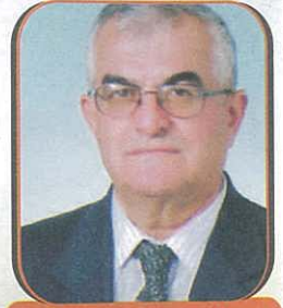
Hazırlayan: Muzaffer TUNA Mak. Yük. Müh.

2. Aşama 1960 yılında Devlet Planlama Teşkilatı kuruldu. Planlı ekonomik 2. Planlı 1965-1970'li yıllarda sulama ve enerji yatırımlara ağırlık verildi. Kömüre dayalı TERMİK SANTRALLAR enerji nakil hatları, büyük ölçekli hidrolik enerji santrallerinin altyapıları ve projeleri planlandı. 1965-1990 yılları