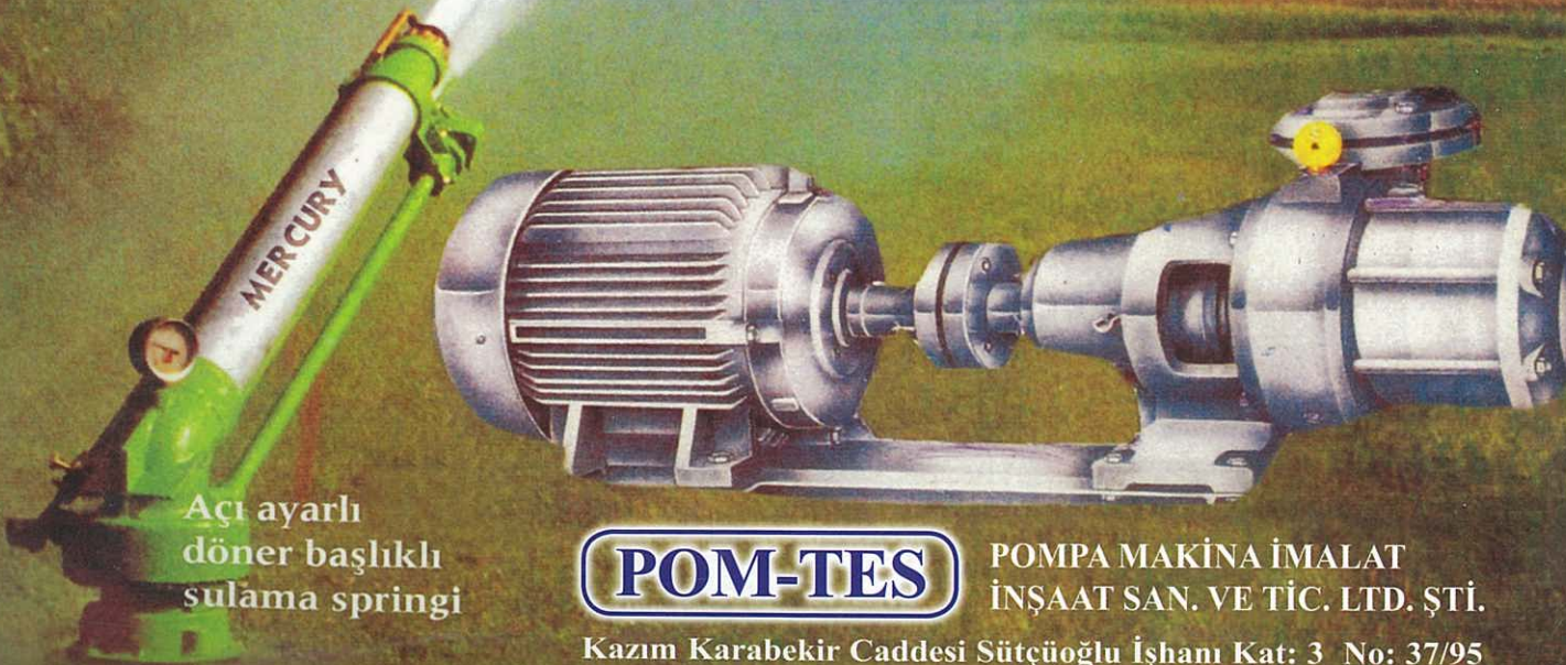
Açı ayarlı döner başlıklı sulama springi