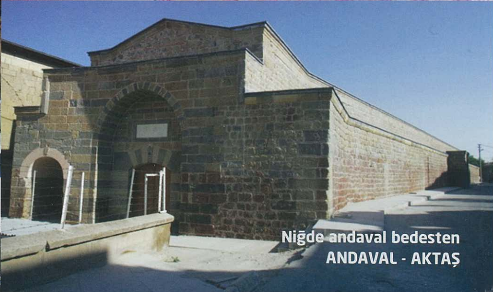
Niğde andaval bedesten ANDAVAL - AKTAŞ